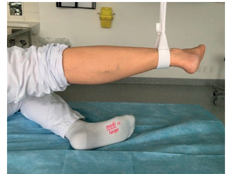
Hofte eller knæ 2006-50