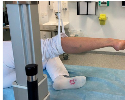
Fodkirurgi, sideleje 2006-50