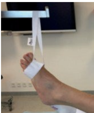
Forfodsløft 2006-60 + 2006-65