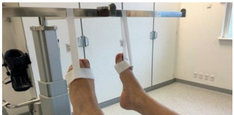
Bilateral forfodsløft 2006-60 + 2006-65