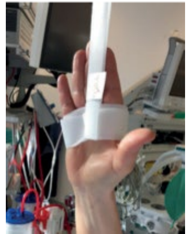
Håndkirurgi 2006-60 + 2006-65