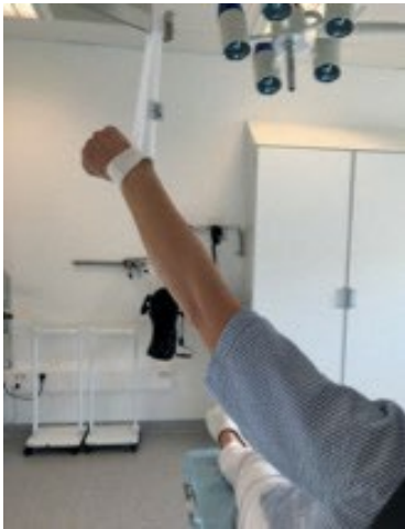
Løft af arm ved beach chair 2006-60