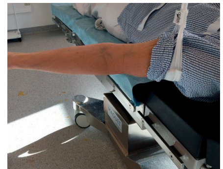
Hånd eller arm kirurgi 2006-50