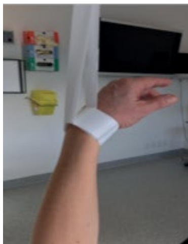
Løft af arm i rygleje 2006-60