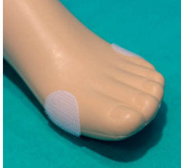
Velcro coin 2006-65