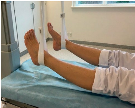
Bilateral løft ved ankel 2006-50